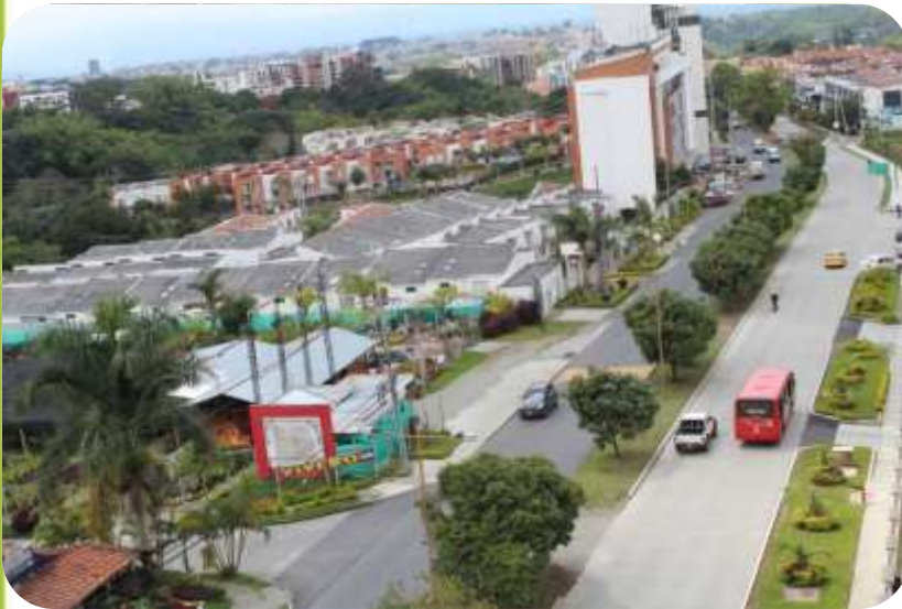
Foto Cra 19 nº 31 norte